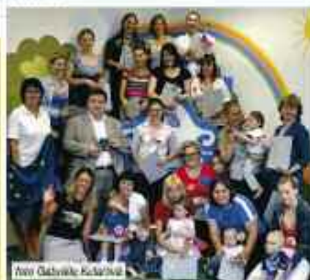
Úspěšné absolvování kurzů projektu Práce a život v rovnováze. V září zahájujeme poslední etapu.

Dětské oslavy, slavnosti a setkání v MUMu.