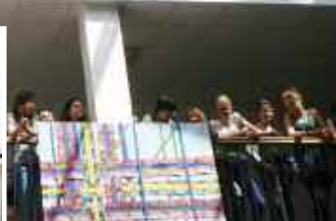
Devátá vernisáž výstavy studentských prací poprvé v atriu školy