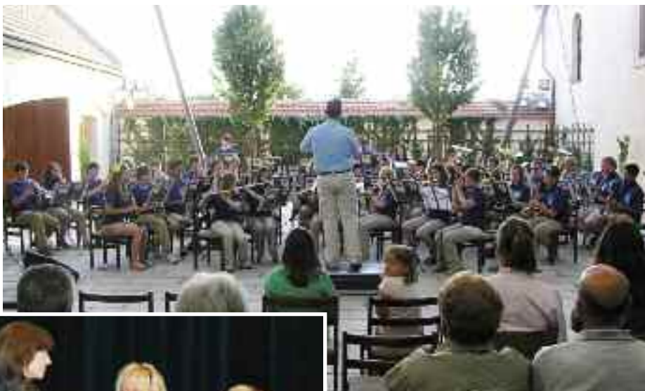
Stevens High School Band z Jižní Dakoty na nádvoří Chvalského zámku