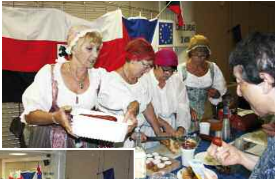
Stánek, na kterém členky Comité de Jumelage představily Horní Počernice a Prahu, byl vyhodnocen jako nejlepší.

Začátkem května se ve francouzském Lyonu konal veletrh partnerských měst, kterého se zúčastnil i Comité de Jumelage (Výbor pro partnerství) z našeho partnerského města Mions. Jejich stánek, který představil Horní Počernice, Prahu a Českou republiku, byl oceněn jako nejlepší. Naši přátelé zde byli jako jediní v českých lidových krojích, a nabídka sýrů, uzenin, piva, vína a dalších tradičních českých a moravských výrobků, které pro tuto příležitost zajistila svému partnerskému