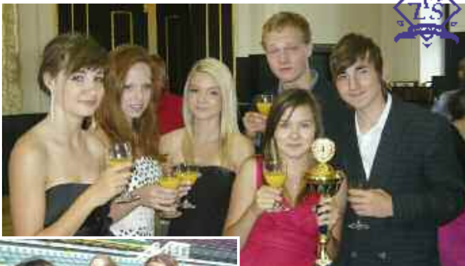
Ani letos nechyběli úspěšní sportovci z FZŠ Chodovická na slavnostním vyhlášení celopražské soutěže O pohár primátora hl. m. Prahy na Staroměstské radnici.

Vrcholem soutěží je krajské kolo atletických disciplín. Umístění všech tří našich zúčastněných družstev bylo letos velice vyrovnané. Třikrát 5. místo ve velice silné konkurenci žákovských reprezentantů z mnoha atletických klubů Prahy je výborné. Na Julisce, kde se tato soutěž konala, si mnoho našich reprezentantů