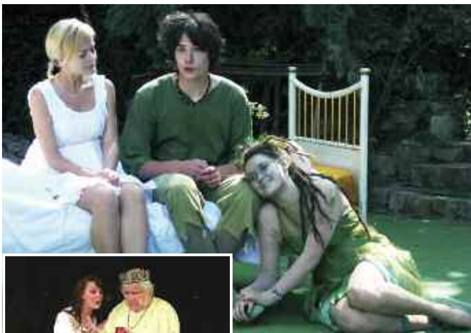
DS Počerničci: Petr Pan /režie B. Jelínková, A. Ptáčková/, foto B. Jelínková Vlevo: DS Výtečníci a Počerničci: Sůl nad zlato /režie J. Sůvová, K. Šimicová/, foto J. Bzenecký

Domácí divadelní soubor Právě začínáme uvedl dva tituly. V pátek 13. května zahájil festival obnovenou premiérou hry Ženský boj a po sedmi týdnech 26. června jsme