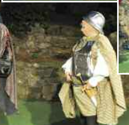
DS Právě začínáme: Ženichové /režie V. Stoklasa /