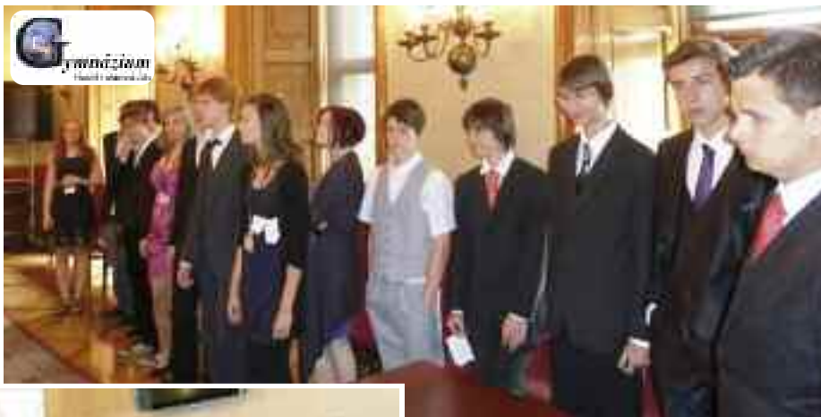
Studenti Gymnázia Chodovická představili v Senátu své práce na Projektu Občan.

Tím ale náš program v Senátu neskončil. V průběhu druhého pololetí jsme se zúčastnili další části projektu, když se nám naskytla možnost spolupráce s Britton Deerfield School z amerického Michiganu. Na několika "setkáních" přes Skype jsme se v hodinách mediální výchovy seznamovali