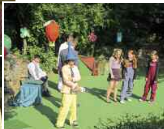
DS Počerničci: Neznámkovy příhody /režie Z. Víznerová, O. Šmejkalová/