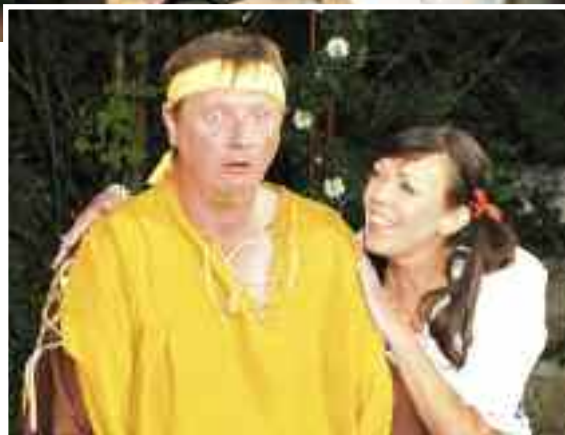
Ženichové v režii Vladimíra Stoklasy

a zbohatlíka Milinského. A na hradě se začnou dít podivné věci, aby "ženichům" zašla chuť na námluvy.