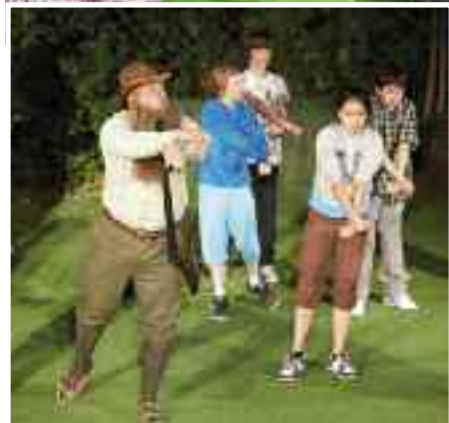
DS Výtečníci a Počerničci: A přece tu straší /režie J. Sůvová, K. Šimicová/

se s festivalem rozloučili novým představením Ženichové. Obě uvedené komedie se souborem nastudoval režisér Vladimír Stoklasa.