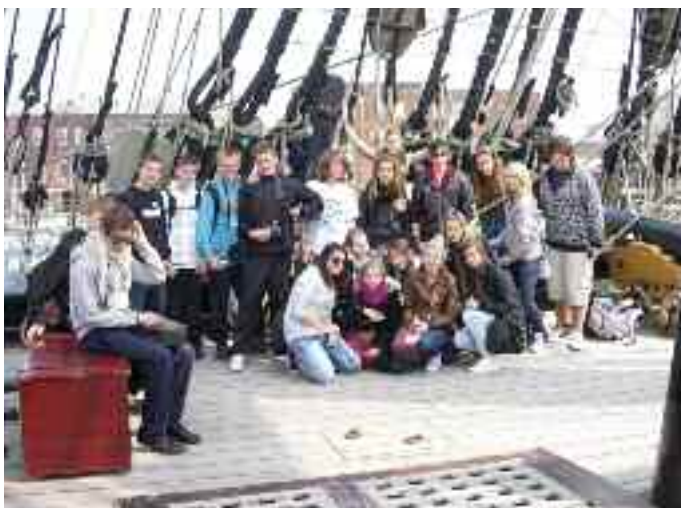
V Portsmouthu jsme si prohlédli nádhernou loď admirála Nelsona Victory.

Po naročném dni, který byl plný dojmů a zážitků, si nás převzaly anglické "maminky a tatínkové na týden". Naplno jsme mohli vychutnat prostředí typické anglické rodiny a mluvit s jejími členy. Další část dne jsme strávili procházkou po bílých křídových úte-