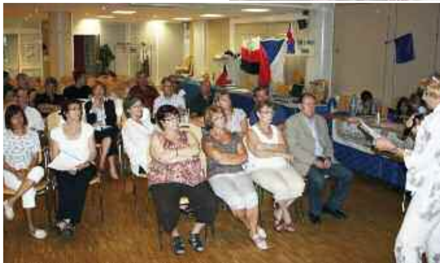
Součástí veletrhu partnerských měst v Lyonu byla také konference.