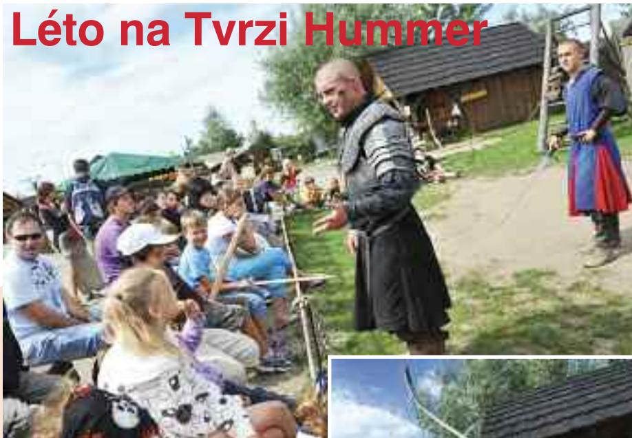
Léto na Tvrzi Hummer v sobě má půvab.

30. července 2011 od 10 hodin brány Tvrze Hummer otevřou pro změnu Piráti. Náležitě pestrý a akční program, který si můžete užít ve společnosti staré pirátské party. Nejspíš si přitom v Tvrzi Hummer ani nevezpomenete, že prázdniny se právě točí do své druhé poloviny!