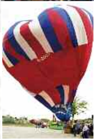
Na oslavě sportovali nejen zaměstnanci firmy, ale také rodinní příslušníci a zejména děti.